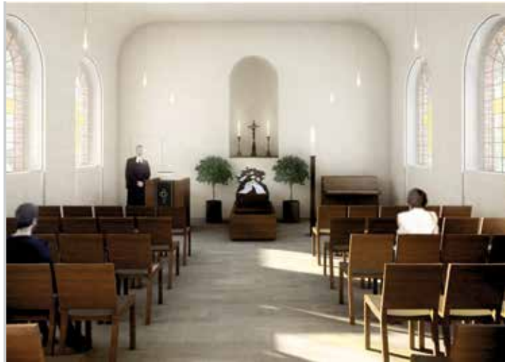
Der Innenraum der Kapelle gewinnt durch die zusätzliche Höhe (o). Unten: Die Kapelle vor dem Umbau

Aufgrund von Verzögerungen der Planung und Ausschreibung der Bauleistungen werden die Bauarbeiten voraussichtlich noch bis zum Jahresende 2020 andauern und somit leider keine Nutzung der Kapelle möglich machen.