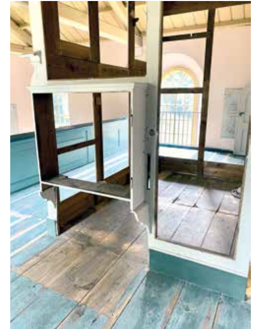
Die Dielung auf der Empore ist wieder eingebaut (re). Blick in die Winterkirche: Die Balken sind repariert (u).

Die Zimmererarbeiten und die Entstaubung des Dachraumes sind abgeschlossen, die Dielung der Orgelepore ist wieder eingebaut. Diese Bauarbeiten sind vom Architekten abgenommen. Zurzeit arbeiten die Restauratoren an der Farbfassung des Orgelgehäuses. Elektrokabel wurden im Zuge der Zimmerarbeiten teilweise bereits verlegt. In der Orgelwerkstatt gehen die Arbeiten auch voran. Bärbel Wunsch