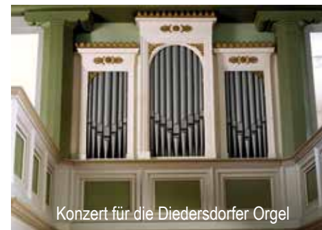
Konzert für die Diedersdorfer Orgel

An der Orgel Regionalkantor Fabian Enders. Der Eintritt ist frei. Um Spenden für die Dahlewitzer Kirche wird gebeten.