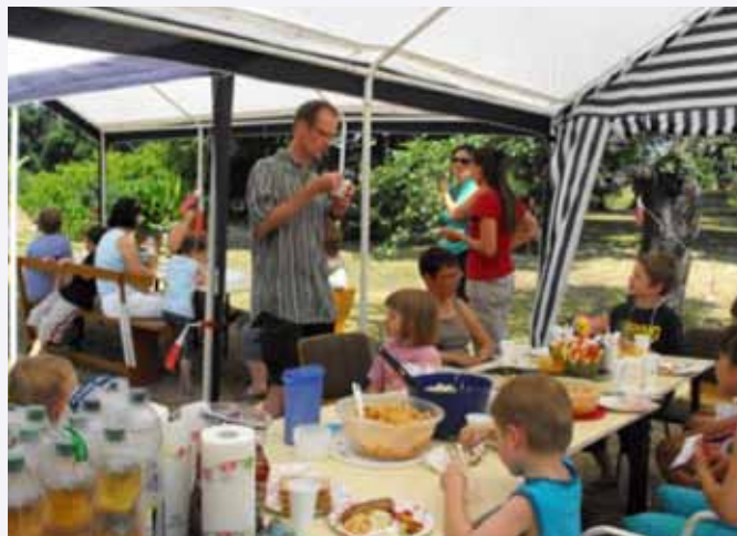
Es schmeckt allen