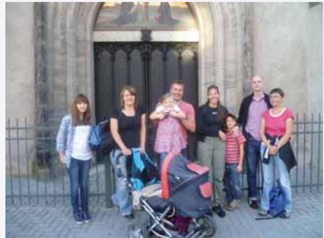
Die Pilger vor der Thesentür