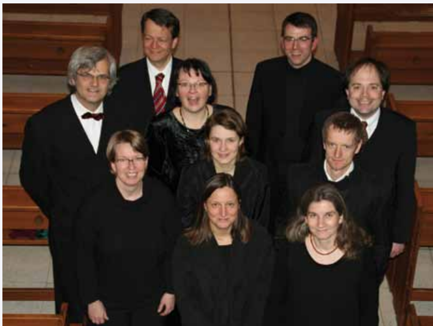
Das Berliner Doppelquintett in seiner jetzigen Besetzung

Die nächsten Termine für den Konfirmandenunterricht sind Samstag, der 17. Dezember, der 21. Januar und der 25. Februar.