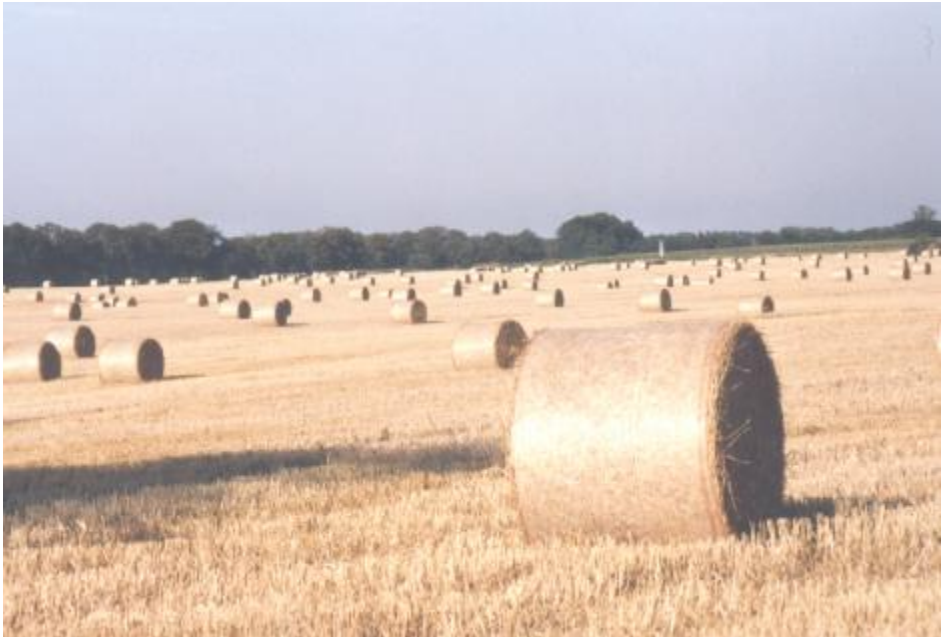
Getreidefeld bei Anklam

Du sorgst für das Land und tränkst es, du überschüttest es mit Reichtum.