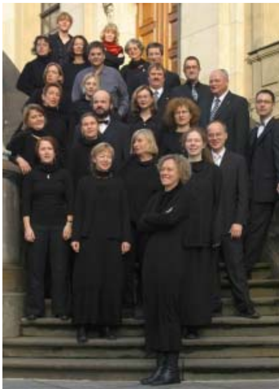
Der Berliner Vokalkreis

Der Eintritt zu diesem Konzert beträgt 8,-, ermäßigt 5,-Euro. Kinder bis 14 Jahren haben freien Eintritt. Karten sind ab dem 17. Oktober im Büro der Kirchengemeinde und in der Brunnenbuchhandlung erhältlich.