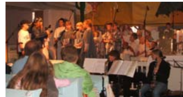
Aufführung in Trebbin