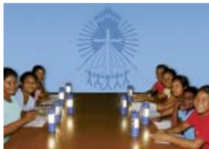
Frauen in Guyana mit Solarlampen

Herzliche Einladung an alle Frauen und Männer!