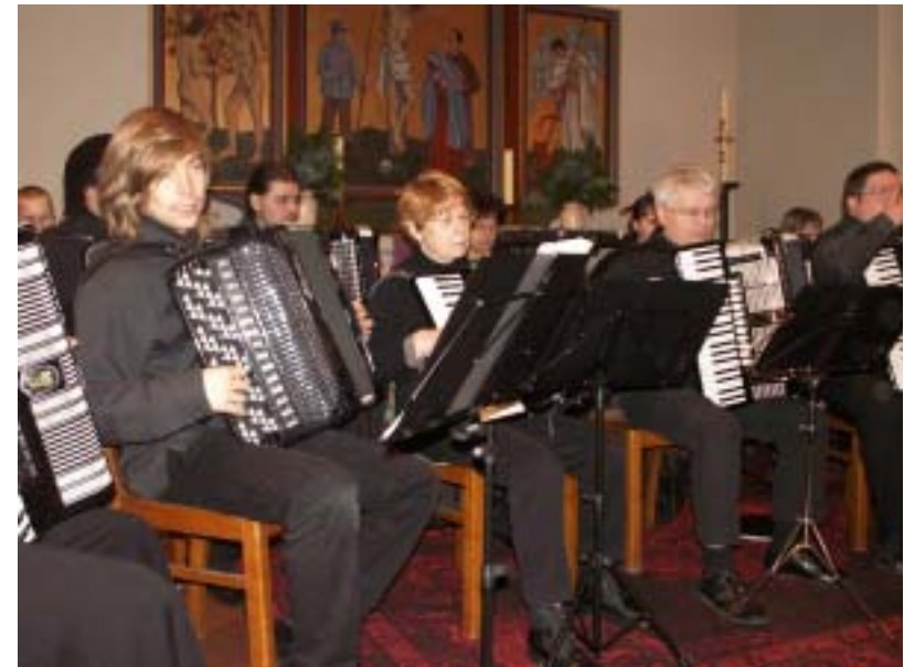
Das Gotteshaus konnte den Klang kaum fassen.