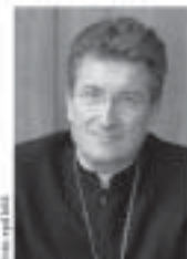
Bischof Dr. Wolfgang Huber Vorsitzender des Rates der Evangelischen Kirche in Deutschland (EKD)