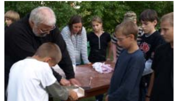
Beim Sägen zeigen die Jungen viel Engagement

Nach dem Ende der Sommerferien startete auch das Konfirmandenprojekt am 5. September in die nächste Runde. Aus den Pfarrsprengeln Ahrendorf, Christinendorf/Glienick und Ludwigsfelde kamen die Konfirmandinnen und Konfirmanden. Neben dem gegenseitigen Kennenlernen haben wir Steine gestaltet mit unseren Namen und unseren Farben.