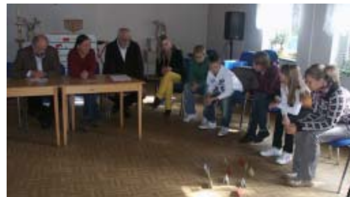
Was machen wir jetzt?

Am 27. September ging es schon weiter. Ein ganzer Tag im Gemeindehaus Schalom führte uns zum Thema: „Menschenbild“ zusammen. Die Arbeit mit der „Gen-Datei“ aber auch die spontanen Spielszenen nahmen uns sehr in Anspruch.