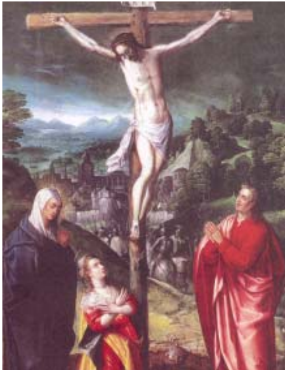
„La Crucifixion“ Art Flamand - Musée de L' Assistance Publique - Hopitaux de Paris - Girodon (Ausschnitt)