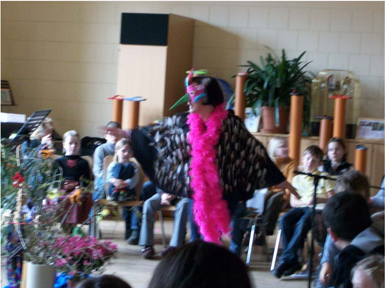
Familiengottesdienst zum Weltgebetstag