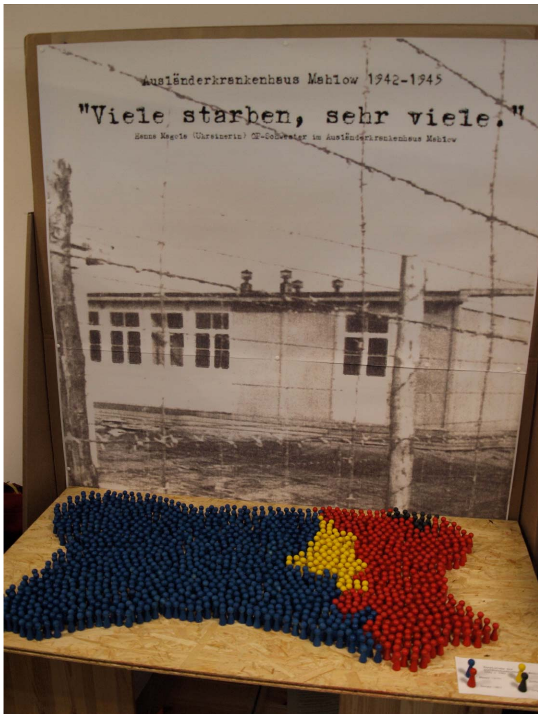
Foto: Die Installation des Zeiteinsprünge – Teams, 1494 Tote (Frauen, Männer, Kinder, Totgeburt)