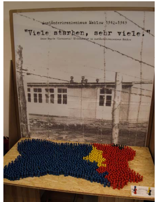
Foto: Die Installation des Zeitensprünge - Teams 1494 Tote (Frauen, Männer, Kinder, Totgeburt)

Das alles haben Schüler und Konfirmanden aus Mahlow herausgefunden, die sich, unter der Schirmherrschaft unserer Kirchengemeinde, ein Jahr lang mit den Lebensumständen der Zwangsarbeiterinnen und Zwangsarbeiter beschäftigt haben. Als „Zeitensprünge“-Projekt wurden die Jugendlichen vom Landesjugendring Brandenburg unterstützt und erhielten von