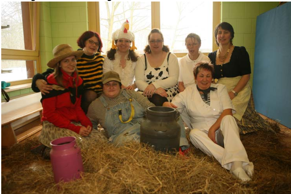
das Kita Team zum Fasching

Der Gemeindekirchenrat hat als Träger der Kita beschlossen, die Kita um einen Krippenbereich im vorhandenen angepassten Bau zu erweitern und hat dies beim zuständigen Amt beantragt .