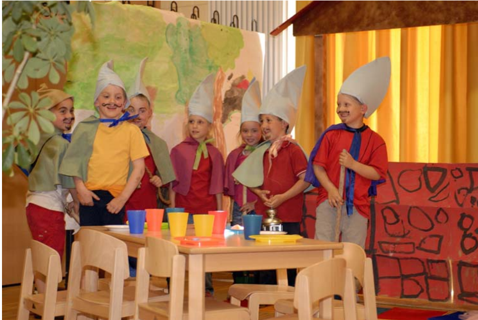
Kita-Kinder spielen „Schneewittchen“