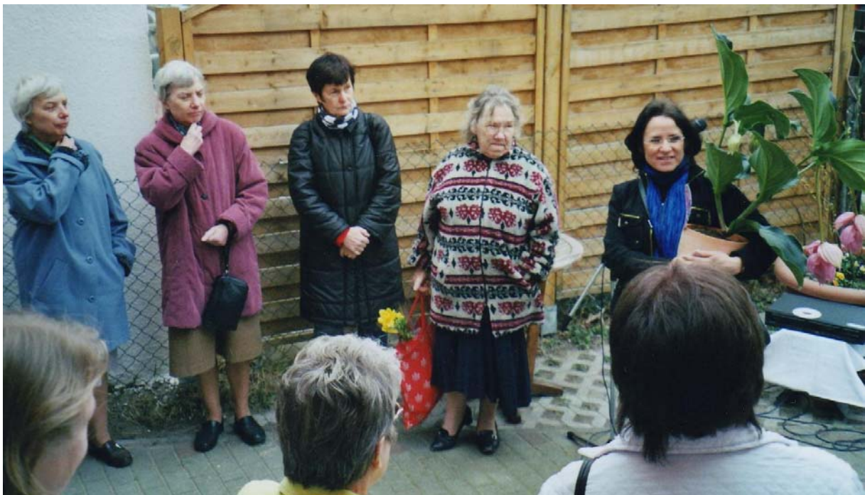
- Ladeneröffnung 16.3.2007 -