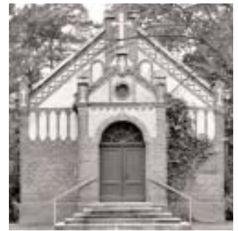
Die 100-jährige Friedhofskapelle ist sanierungsbedürftig und sollte einen barrierefreien Zugang bekommen.