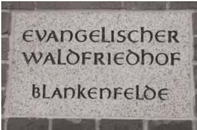
Die neue Tafel am Eingang des Waldfriedhofs von Blankenfelde