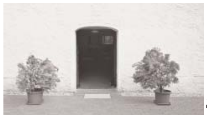
Die Diedersdorfer Kirchtür steht einmal monatlich weit offen für Konzertbesucher.

Am 29. April und 20. Mai zwischen 9.30 und 12 Uhr soll der große Diedersdorfer Pfarrgarten wieder intensiv gehegt werden. Das gemütliche gemeinsame Frühstück wird natürlich nicht fehlen. Viele fleißige Helfer sind herzlich willkommen.