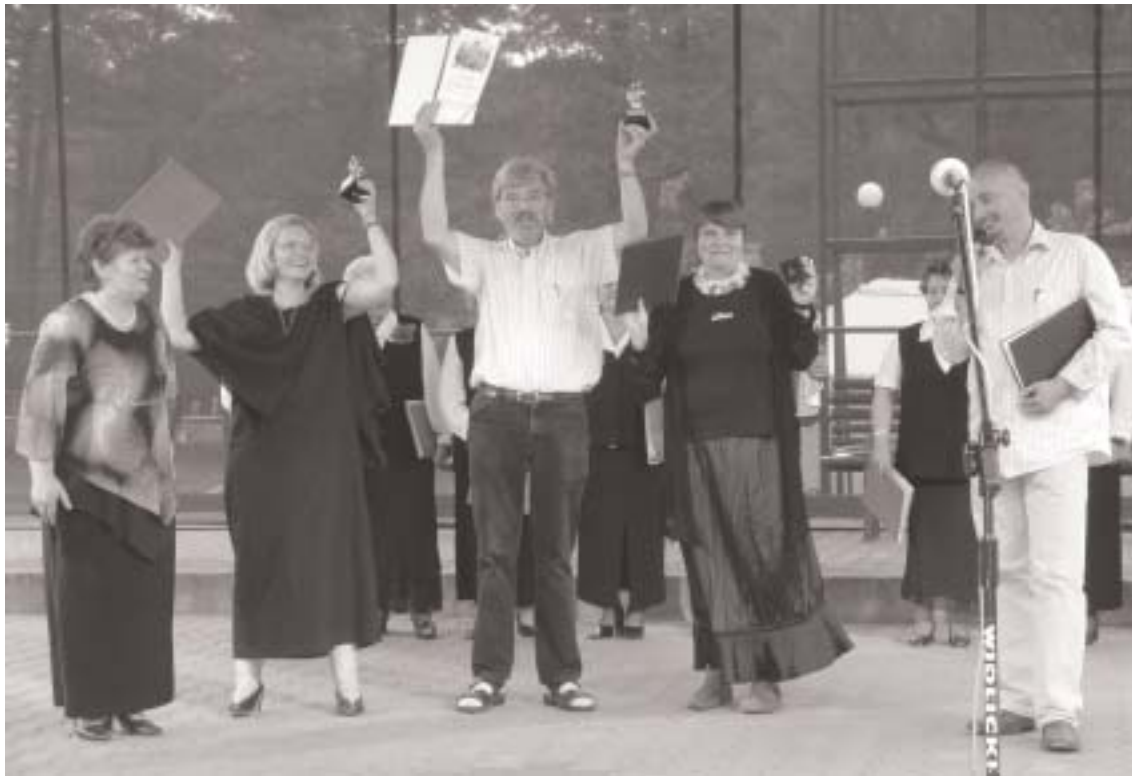
Sie ernteten viel Applaus: Die Blankenfelder Musiker bei der 770-Jahrfeier in Szczaniec.