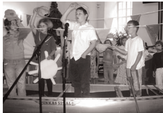
Das Kindermusical „Die Stillung des Sturms“ erfreute am zweiten Pfingstfeiertag Groß und Klein.