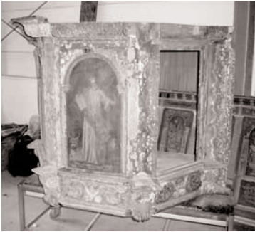
Die alte Blankenfelder Kanzel soll wieder hergestellt werden.