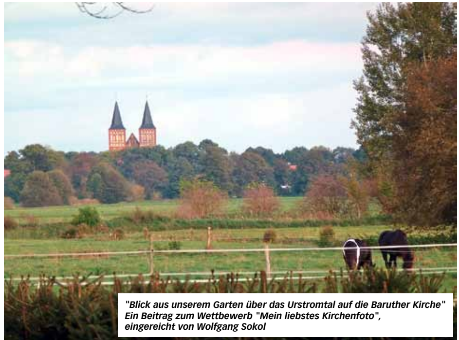
"Blick aus unserem Garten über das Urstromtal auf die Baruther Kirche" Ein Beitrag zum Wettbewerb "Mein liebstes Kirchenfoto"

Es zeigt die beiden imposanten Türme der Kirche St. Sebastian in Baruth. 100 Jahre sind diese Türme jung, 1909 erbaut. Inzwischen bieten sie nicht nur der Gemeinde einen warmen Platz für Gottesdienste im Winter. Von Frühjahr bis Spätsommer herrscht dort reger Flugverkehr, denn sie sind auch Brutplatz für Turmfalken.