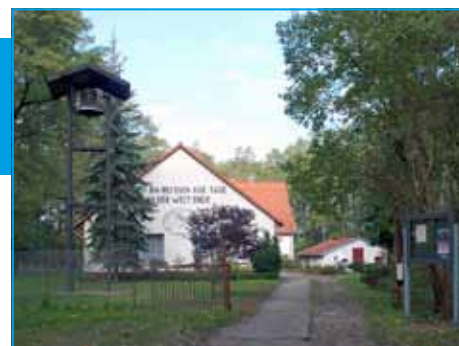
Gemeindezentrum Klausdorf am Reformationstag Kirchengemeinde Sperenberg