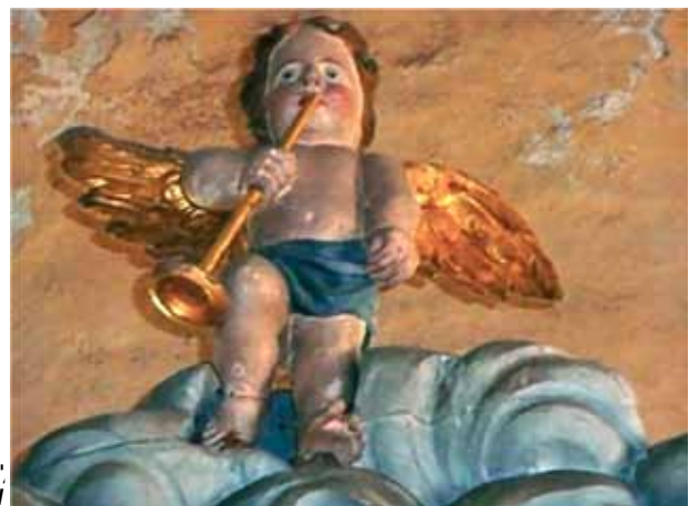
"Posaunenengel in der Kirche zu Paplitz" eingereicht von Wolfgang Sokol

Herr W. Sokol stellte uns drei Bilder zur Verfügung, zwei davon fanden gleich in den laufenden Beiträgen ihre Anwendung. Das erste sehen Sie auf Seite 5 oben ("Winterbild der Kirche zu Paplitz"), das zweite können Sie links auf Seite 10 oben bewundern ("Blick aus unserem Garten über das Urstromtal auf die Baruther Kirche"). Das dritte Bild sehen Sie nun rechts. Viel Spaß bei der Auswahl Ihres Favoriten!