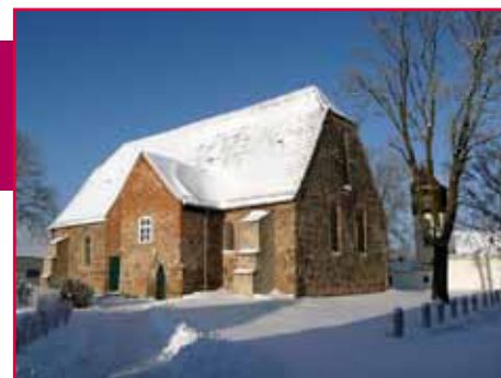
Kirche zu Paplitz Kirchengemeinde Paplitz

11.11.11? Klar, das ist der Tag, an dem die Kinder mit ihren Laternen durch Baruths Straßen ziehen. Doch halt! Nicht so schnell. Angefangen hat es natürlich in der Kirche. Bis zum letzten Platz war sie gefüllt mit Großen und Kleinen. Dort lauschten alle gespannt der Martinsgeschichte, die in diesem Jahr mit einem Schattentheater aufgeführt wurde. Als wir aus der Kirche auszogen, wartete schon Martin hoch zu Ross mit zwei Begleitern auf uns. Schnell die Laternen an und los! Die Baruther Posaunen spielten Martinslieder. Wir staunten nicht schlecht, was "unsere Baruther Trompeter" in den wenigen Monaten alles gelernt haben. Bei Mond- und Laternenschein fanden wir dann doch den Rückweg über den Hackweg, wo das Martinsfeuer brannte, die Hörnchen geteilt wurden und sich alle bei deftigem Bratwurst stärkten. MMI