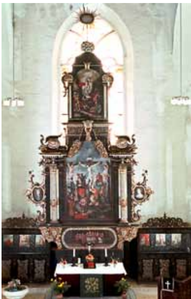
Hochaltar. © Dietrich Oltmanns, Lindenbrück

die Ständeordnung zu jener Zeit ausgedehnt hat. Ein Kirchstuhlregister von 1714 gibt mehr von der Sitzordnung preis. Der Altar, der hoch in den Himmel strebt, stellt die Abendmahlsszene, die Kreuzigung und die Auferstehung Jesu dar. Er läuft auf eine Spitze mit dem hebräischen Gottesnamen zu und verweist damit auf die jüdischen Wurzeln der christlichen Gemeinde. Am meisten wundern sich die Besucher jedoch über die Beichtstühle, die mit prächtigen Bildern ausgestattet sind. Beichtstühle in einer protestantischen Kirche? Jawohl! Denn in der lutherischen Kirche war die Einzelbeichte bis ins 18. Jahrhundert üblich. Natürlich bietet die Kirche St. Sebastian auch sonst viele "Perlen". Eine Kanzel mit der Darstellung der 12 Apostel gehört dazu. Wer christliche Symbole studieren möchte, mag