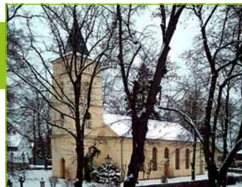
Kirche zu Wünsdorf Kirchengemeinde Wünsdorf