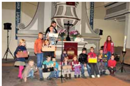
Nr. 16 (Dezember 2011 bis Februar 2012)

zur musikalischen Begleitung bei. Zum Kindergottesdienst luden die beiden Katechetinnen ein; mit einer großen Kinderschar wurde die Bedeutung der "Burg" im Leben Luthers thematisiert und schöpferisch umgesetzt. Der Abendmahlskreis mit Kindern vereinte dann die Region am Tisch des Herrn. Natürlich wurden die Ereignisse und Wirkungen des 31. Oktober 1517 in den Blickpunkt gerückt. Da durfte "Ein feste Burg ist unser Gott", Luthers liedhafte Neufassung des 46. Psalms, als Eingangsgesang nicht fehlen. Insbesondere die Predigt setzte sich dann mit der Frage auseinander: "Warum feiern wir (noch) heute den Reformationstag?" Vielfältige Antworten darauf gipfelten in der Aufforderung an unsere Kirche und an jeden Einzelnen, immer wieder neu über