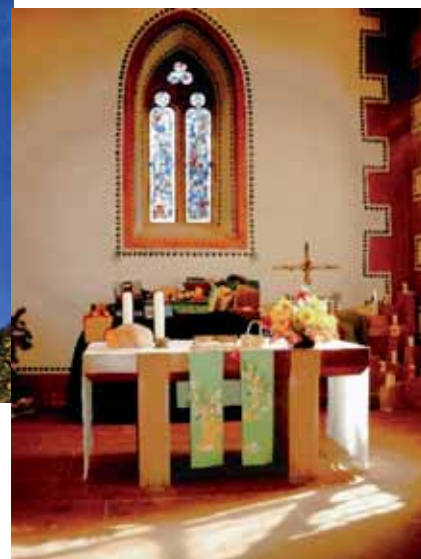
Abbildungen: Kirche Wollbach

Vom 2. bis zum 6. Oktober 2008 werden wir unsere Partnergemeinde in Wollbach besuchen. Mit dem bewährten Busunternehmen Schulze aus Klausdorf werden wir uns auf den leider etwas langen Weg machen. In Wollbach wohnen wir bei Gemeindegliedern und werden das Erntedankfest miterleben. Der festliche Gottesdienst wird traditionell von den gemeinsam singenden Kirchenchören