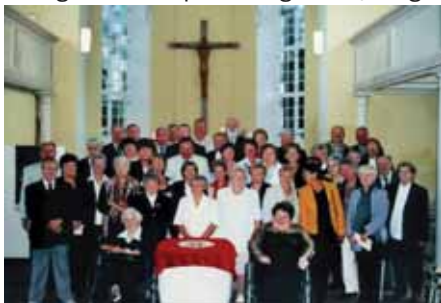
Abbildung: Goldene Konfirmanden und Jubelkonfirmanden 2007

Am 14. September 2008 werden wir in Sperenberg wieder die Goldene Konfirmation feiern. Dazu sind alle, die vor 50, 60, 70 oder 75 Jahren in Sperenberg konfirmiert wurden oder anderswo konfirmiert wurden, aber jetzt im Bereich der Kirchengemeinde Sperenberg leben, einge-