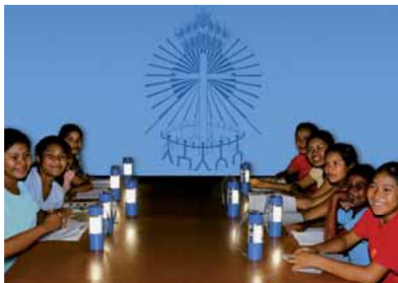
Abbildung: AmazonasWald-Kanada-Initiative e.V./ Winslow Craig, Guyana. Copyright Weltgebetstag der Frauen – Deutsches Komitee e. V.

In den Frauenkreisen der Gemeinden haben wir uns