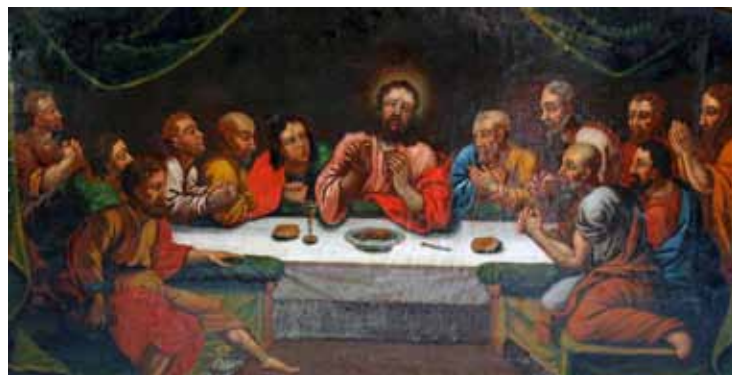
Er hat ein Gedächtnis gestiftet seiner Wunder, der gnädige und barmherzige Herr. Ps 111,4

In der Evangelischen Kirche wird der Gründonnerstag als Tag der Einsetzung des Heiligen Abendmahls mit in der Regel abendlichen Abendmahlsgottesdiensten gefeiert. So wird an das letzte Abendmahl Jesu erinnert, das er mit seinen Jüngern am Tag vor seiner Kreuzigung in Jerusalem gefeiert hat. Es war das Passahmahl am Sederabend zu Beginn des mehrtägigen Passahfestes. Brot wurde gegessen und dazu Wein getrunken – wie immer. Aber bei dieser Mahlzeit sagte Jesus diese besonderen Worte, die Brot und Wein mit seinem Sterben am Kreuz in Verbindung brachten: Für euch gegeben und vergossen zur Vergebung der Sünden. Tut dies zu meinem Gedächtnis.