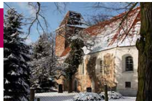
Kirche zu Schenkendorf Kirchengemeinde Groß Ziescht

Geöffnet: Di 13:00 Uhr bis 16:00 Uhr Mi 11:30 Uhr bis 13:30 Uhr Do 09:30 Uhr bis 13:30 Uhr