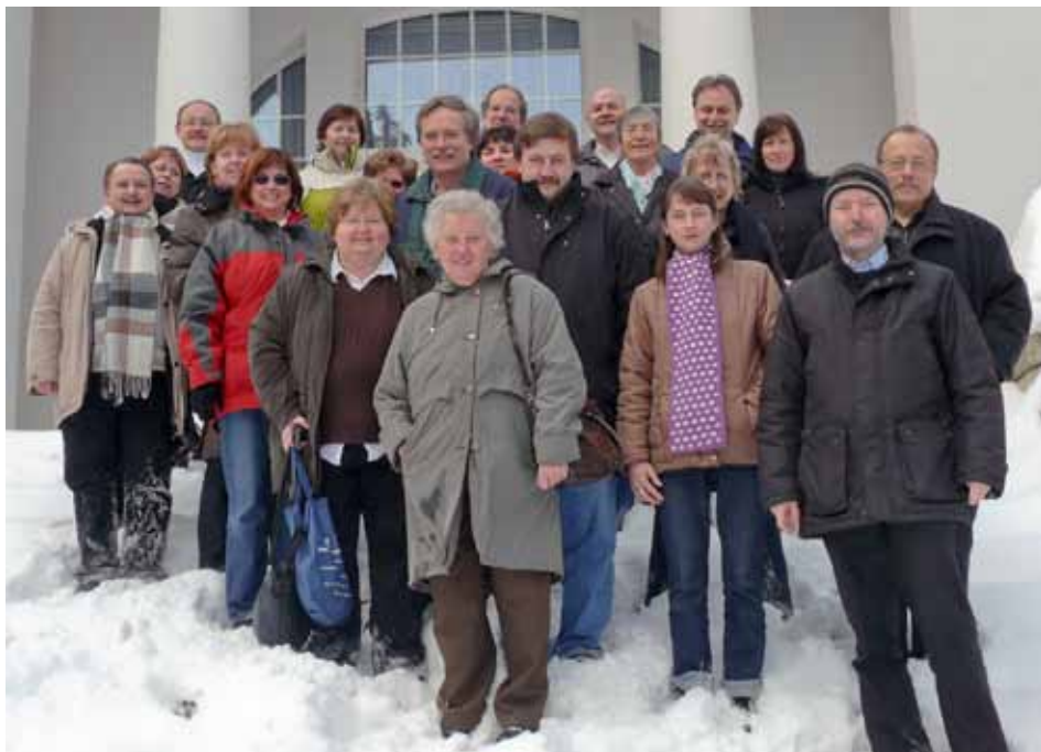
Nr. 9 (März bis Mai 2010)