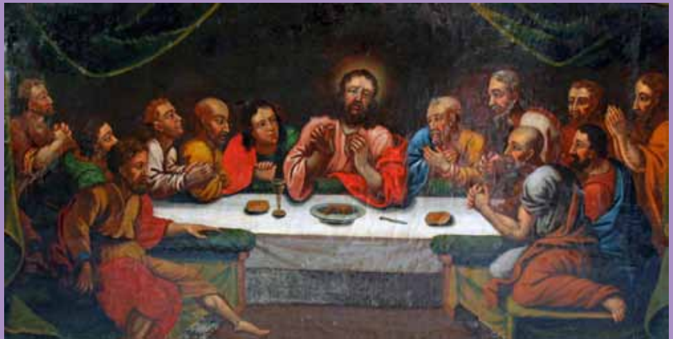
Das Letzte Abendmahl Predella des Paplitzer Altars

Konfifahrt 2010 nach Paplitz Konfirmation Unsere zweite Kinderchorfahrt