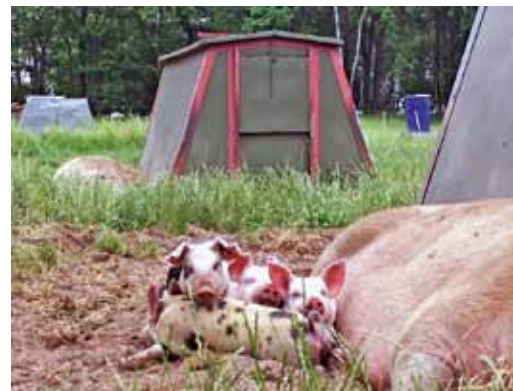
Landwirtschaft in Neu-Lübbenau