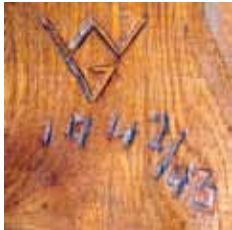
Monogramm von Wilhelm Groß im Rahmen des Passionsreliefs