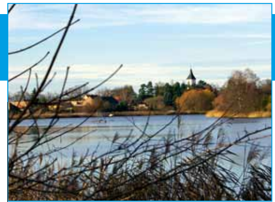
Kirche zu Sperenberg Kirchengemeinde Sperenberg

net und verboten. Aber gerade dadurch wurde er zu dem Künstler der Bekennenden Kirche. In vielen Kirchen, Kapellen, Gemeinderäumen und auch Spitälern finden sich heute seine Werke.