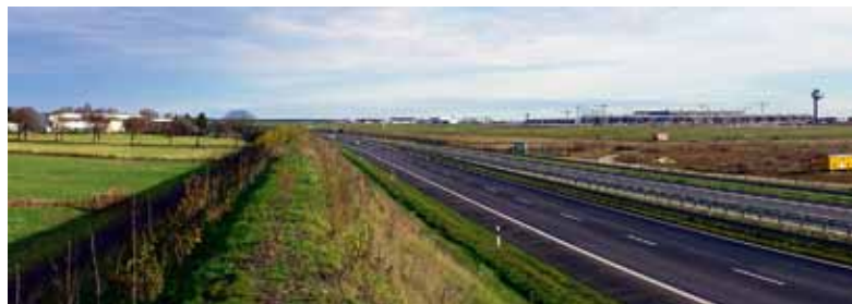
Flughafen BBI mit Schallschutzstreifen

Sicher ist, dass beide Bauprojekte aktuell sehr hohe öffentliche Anteilnahme erfahren und ich gestehe Ihnen, dass ich durch die Fülle der Informationen momentan Mühe habe, wirklich alle der vorgebrachten Meinungen