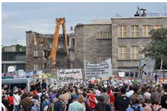
Abbrucharbeiten und Demonstration am Nordflügel des Stuttgarter Hauptbahnhofs.

Vielleicht geht es Ihnen momentan auch so, wenn Sie die Tagespresse aufschlagen oder abends die Nachrichten im Fernsehen schauen, dass nahezu kein Tag in den letzten Wochen vergeht, an dem keine Meldungen über o.g. Bauprojekte enthalten sind. Das ist schon komisch! Oder doch nicht?