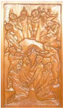
Die vier Seiten des Taufbeckens von Wilhelm Groß in Sperenberg