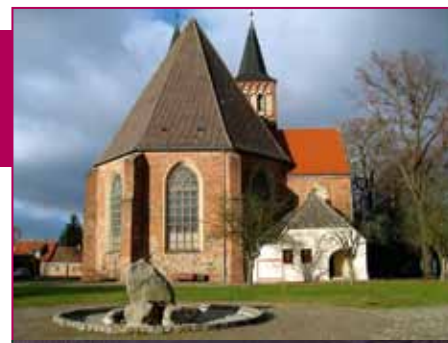
St. Sebastian Kirchengemeinde Baruth

Geöffnet: Di 09:30 Uhr bis 12:30 Uhr Do 09:30 Uhr bis 12:30 Uhr