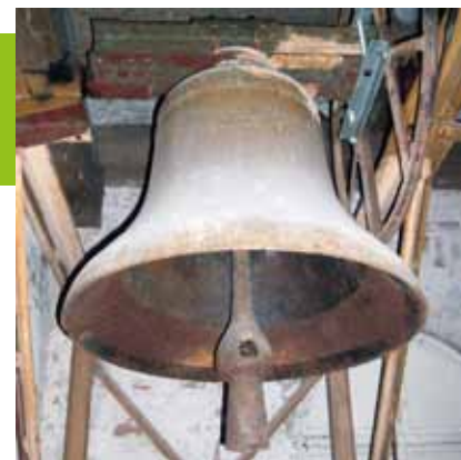
Glocke "Eleison" in der Kirche zu Wünsdorf Kirchengemeinde Wünsdorf

D ie Kunde von der ersten kirchlichen Feierstunde seit Kriegsende verbreitete sich schnell, doch erst zum Heiligen Abend 1945 sollte sich die Kirche füllen. Die Kerzenreste auf dem Altar warfen ein blasses Licht auf das Jesuskind in der Krippe. Und dann der Schrecken: Als die Gemeinde "Stille Nacht, heilige Nacht!" sang, knarrte die schwere Kirchentür noch einmal. Der Gesang wurde leiser, und erschrockene Gesichter erkannten, dass zwei russische Soldaten mit Maschinenpistolen hereingekommen waren. Leise, obwohl sie schwere Stiefel an hatten, schlichen sie