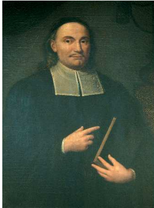
ASSOCIATION OF THE EVANGELICAL CHURCHES OF MITTENWALDE

DER EVANGELISCHEN KIRCHENGEMEINDEN MITTENWALDE, RAGOW UND MOTZEN