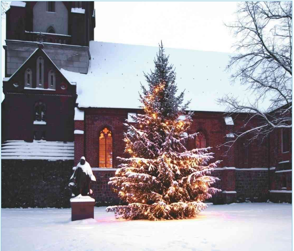
Weihnachten an der St.-Moritz-Kirche Mittenwalde

Evangelische Kirchengemeinden Mittenwalde, Ragow und Motzen